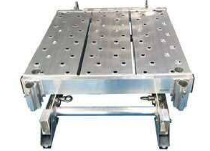
踊り場ユニット本体