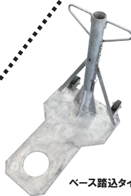
ベース踏込タイプ