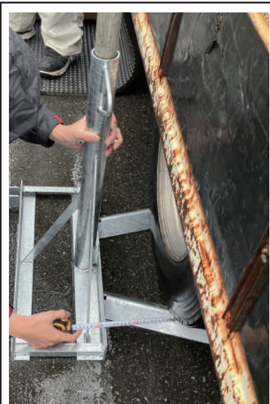
タイヤへ確実に食い込ませること