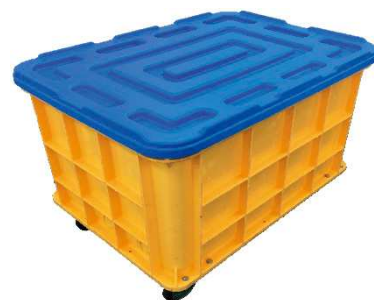
オプション品にて専用フタ も取り扱っています (400型・500型のみ)