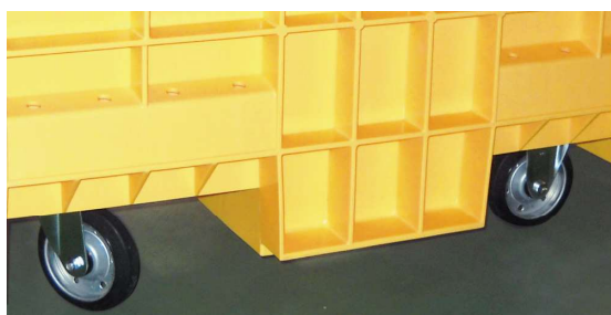
Φ150キャスター(400型・500型) Φ100キャスター(200型)付で移動がラク