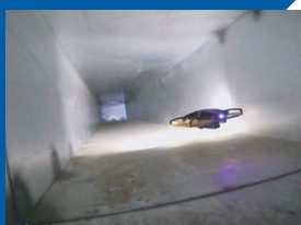
ダクト・配管内部