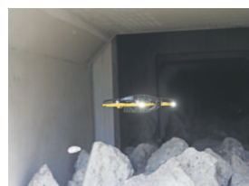
下水道・カルバート内部