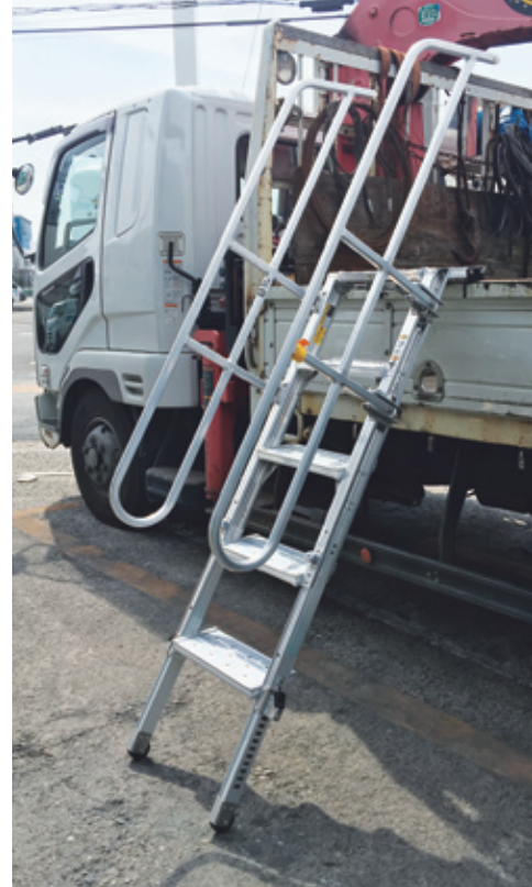
1t～10tトラックまで使用可能！ (車種・形状・使用条件によっては設置できない場合もあります)