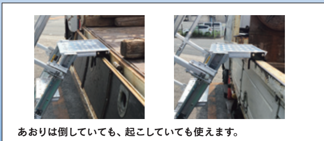
あおりは倒していても、起こしていても使えます。