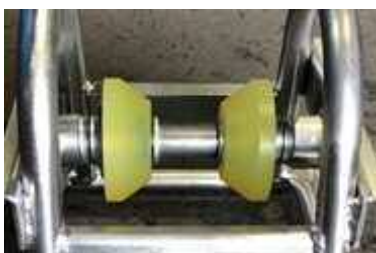
ウレタンローラー